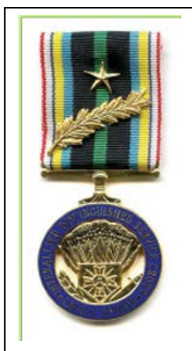
Distinguished Merit Cross With Palm and Star (Militairen)