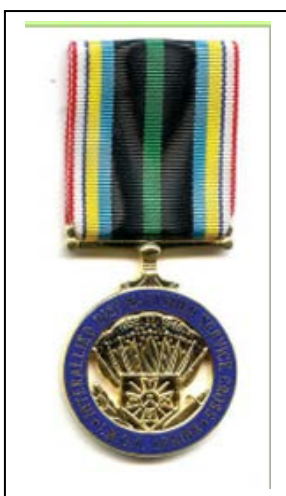
Distinguished Merit Cross (Burgers)

Verantwoordelijke Uitgever : Karel Laeremans - Goossensvest 46 - 3300 Tienen