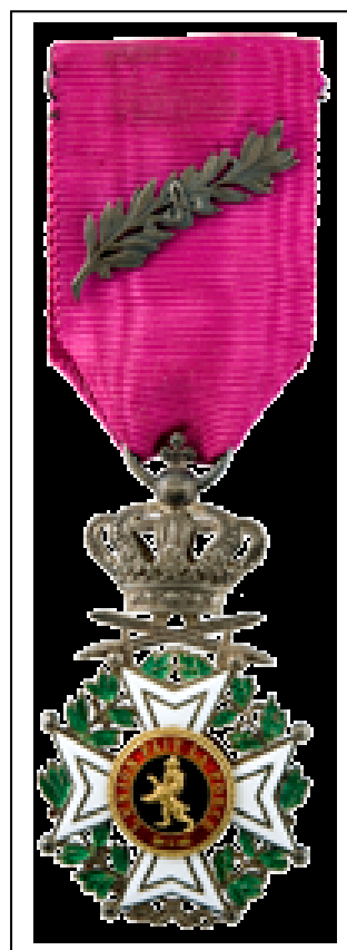
Medaille Koninkrijk België Wereldoorlog 1 Leopoldsorde, Ridder ten militaire titel, met palm