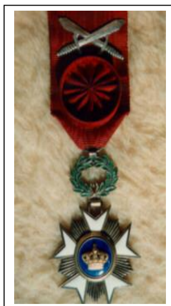
Medaille Koninkrijk België Wereldoorlog I Orde van de Kroon Officier

Door het Koninklijk Besluit van 14 februari 1939 werden zilverkleurige gekruiste zwaarden ingesteld voor drie Belgische ridderordes (Orde van Leopold I, Kroonorde en Orde van Leopold II) om aan te duiden dat het ereteken werd toegekend voor verleende diensten in oorlogstijd.