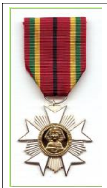
Medaille Imos Order of Merit Cross Knight

Verantwoordelijke Uitgever : Karel Laeremans - Goossensvest 46 - 3300 Tienen