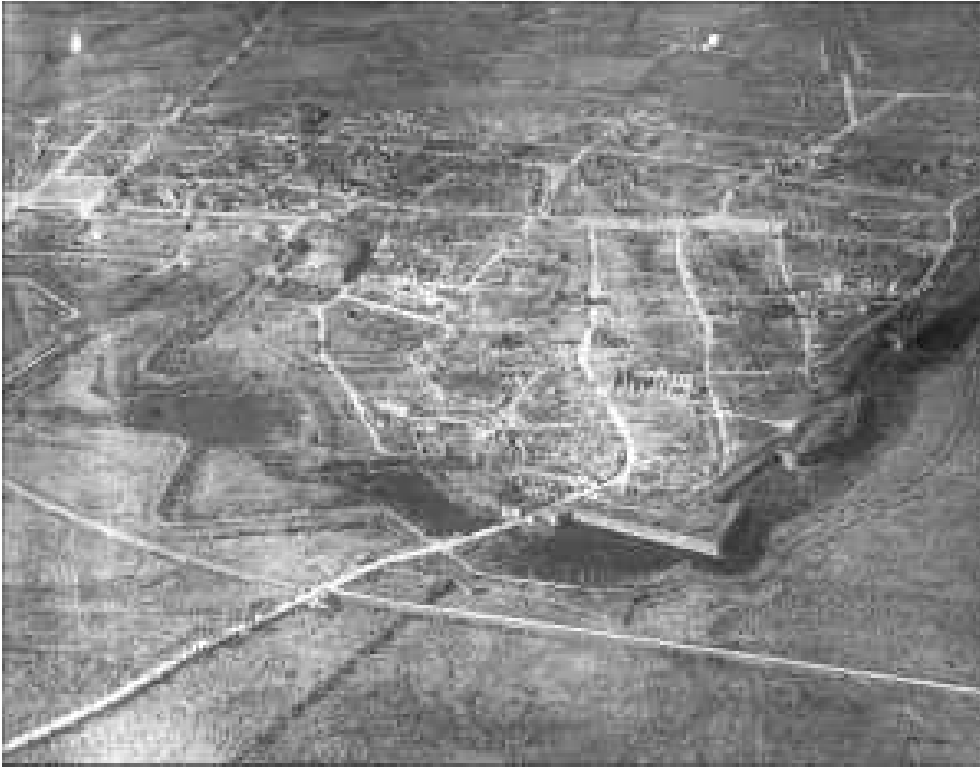
Luchtfoto van Ieper 1919

ontstonden hoge werkloosheidscijfers (tot 800.000). De overheid kon ook niet veel betekenen, omdat er niets was. Maar organiseerde, om de bevolking enigszins op te vrolijken en de aandacht af te leiden van alle ellende, de Olympische Spelen, die in 1920 in Antwerpen werden gehouden. Duitsland mocht daaraan niet meedoen.