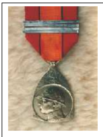
Herinneringsmedaille van de Oorlog 1914 - 1918