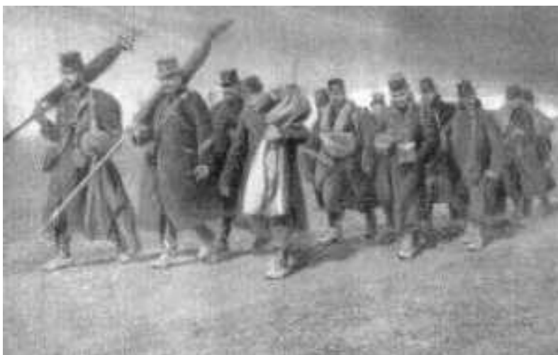
Terugtrekking achter de IJzer

De Duitsers vielen België binnen op 4 augustus 1914. De Duitse opmars werd tegengehouden door de Belgen die zich terugtrokken in de forten van Luik. Maar ondanks de zware forten werden de Belgen teruggedreven tot Antwerpen, waar men standhield achter de forten aldaar. Er deden zowel in België maar ook elders geruchten de ronde dat de Duitsers nonnen doodden en de handen van de kinderen afhakten, maar dit bleek allemaal geallieerde propaganda. Toch werden er heel wat burgers gedood en mishandeld, merendeels omdat ze zich verzetten. 183 burgers werden op 19 augustus 1914 terechtgesteld nadat men een Duitse officier neerschoot. Leuven viel diezelfde dag en werd in de nacht op 25 en 26 augustus als represaille platgebrand waardoor er circa 1130 gebouwen in vlammen opgingen en meer dan 200 burgers omkwamen. Onder die circa 1130 gebouwen was de bibliotheek met eeuwenoude waardevolle boeken die allemaal verloren gingen.