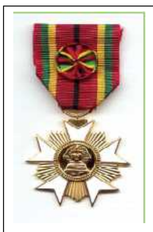
Medaille Imos Order of Merit Cross Officer

Toegekend aan Belgische burgers die in de rangen van de Belgische strijdkrachten dienden gedurende de Wereldoorlog en voldeden voor de criteria van de Overwinningsmedaille.