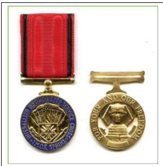
Medaille Imos Interallied Distinguished Service Cross

Verantwoordelijke Uitgever : Karel Laeremans - Goossensvest 46 - 3300 Tienen