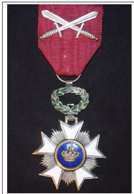
Medaille Koninkrijk België Ridder in de Kroonorde.